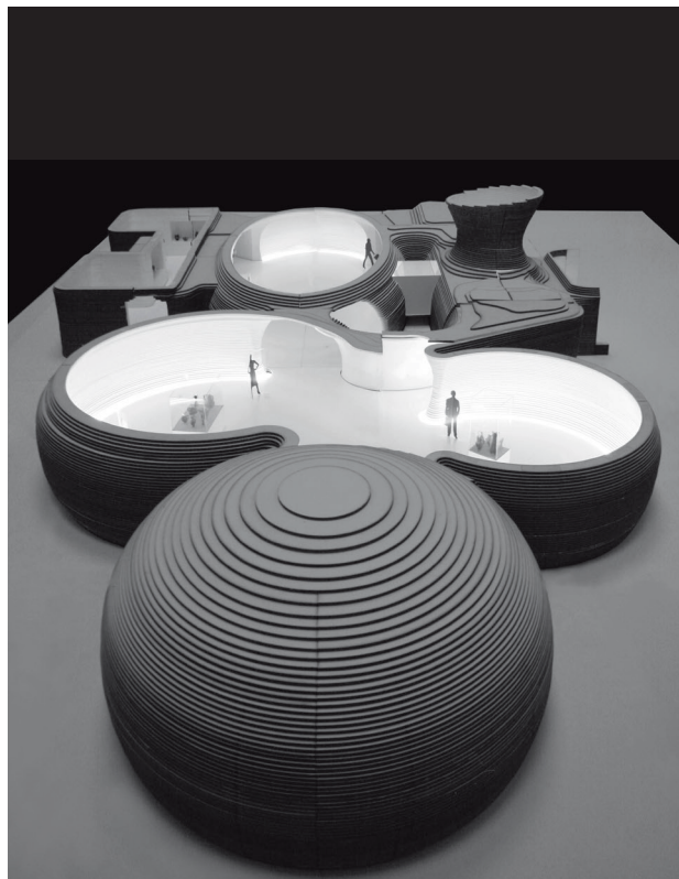
Museum of Etruscan Art, Milan, Italy