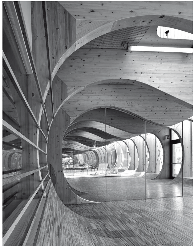
Balena nursery school, Guastalla, Italy